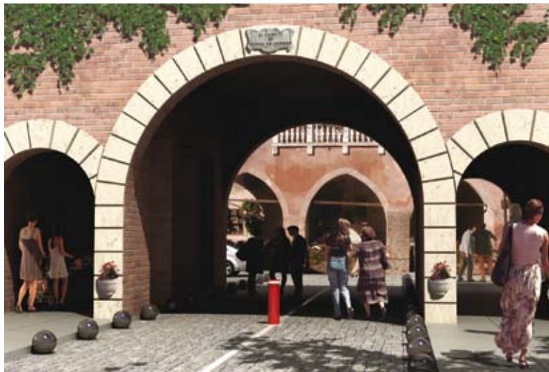
délimitation de centres historiques