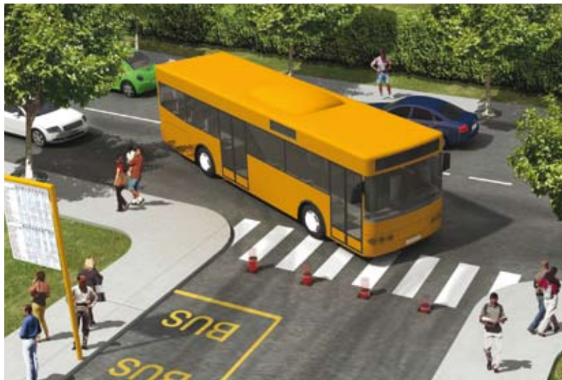
voies réservées aux transports publics