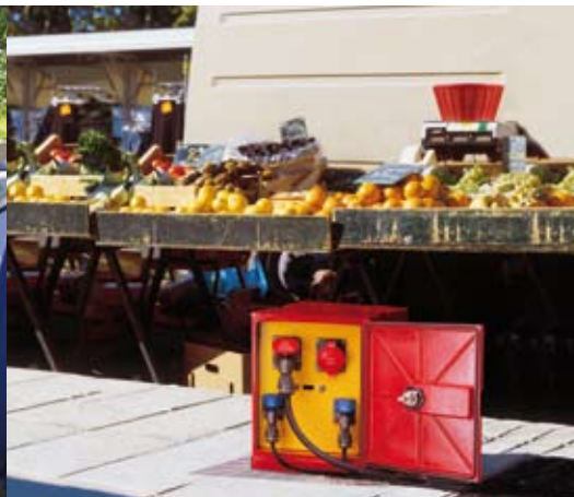
bornes rétractables de distribution d'énergie