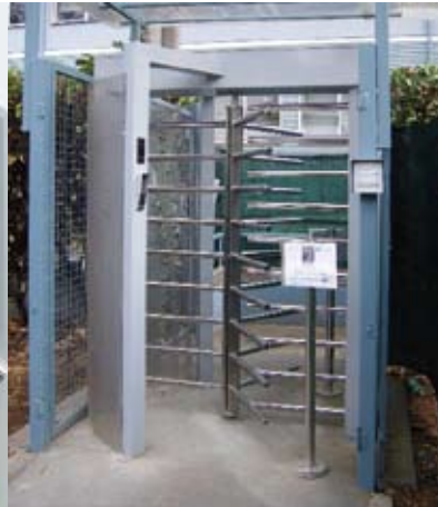
tourniquets de sécurité