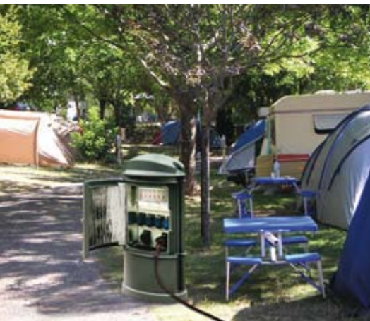
bornes fixes de distribution d'énergie