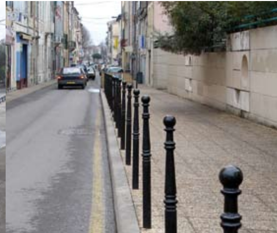
délimitation des trottoirs

Les citoyens ont besoin de se sentir protégés et sécurisés de maintes façons. Une ville organisée, propre et automatisée sera bien aimée et appréciée des touristes qui répandront leur satisfaction de bouche à oreilles. Les bornes fixes ou amovibles, les bancs ou les poubelles sont des produits indispensables à intégrer dans l'environnement urbain et aux abords des édifices. En choisissant le bon rapport technologie/design, il est possible de délimiter les espaces dans tous les contextes architectoniques pour garantir la sécurité des citoyens, créer des aires de repos ou pour empêcher les véhicules de se garer dans certains endroits.