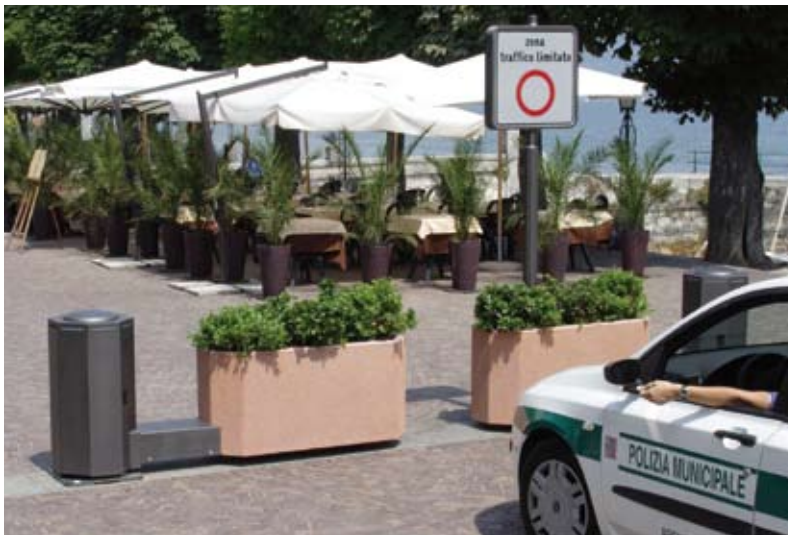
bacs à fleurs pivotant automatiquement