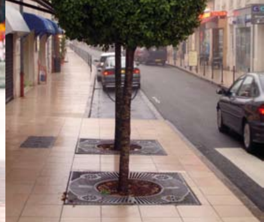
aménagement de zones verdoyantes