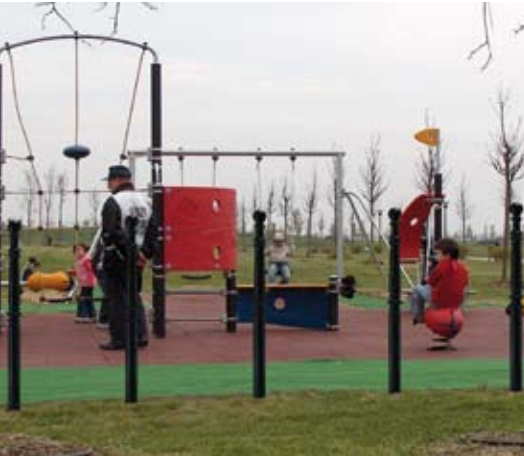
protection des zones vertes