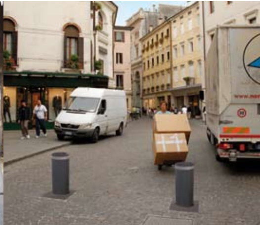
zones à trafic restreint