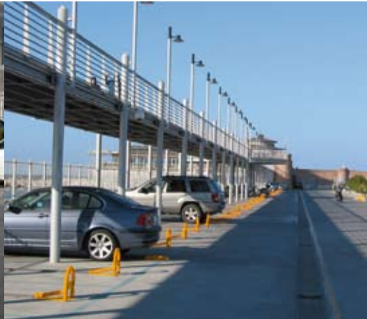
réservation de places de parking individuelles