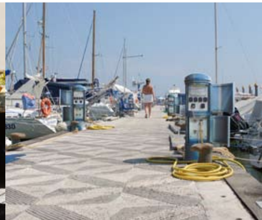
bornes de distribution d'énergie mixtes (électricité et eau)

Partout où il y a un besoin temporaire en énergie (électricité, eau ou autres services), les bornes de distribution d'énergie fixes et rétractables sont la solution idéale pour garantir l'approvisionnement d'énergie en toute sécurité. Ce type de borne met un terme à l'utilisation de câbles, aux branchements dangereux, aux raccords pirates et aux risques liés aux câbles qui jonchent le sol. Il assure une totale sécurité aux utilisateurs et aux citoyens. Les contextes d'utilisation sont nombreux: marchés, foires, fêtes foraines, expositions, halls de concert, aires de camping, aires de stationnement pour camions, zones multifonctionnelles, salles polyvalentes, complexes sportifs, aires de détente, services techniques, laboratoires, parkings, aéroports et espaces d'accueil.