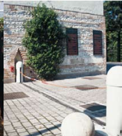
barrières à chaîne