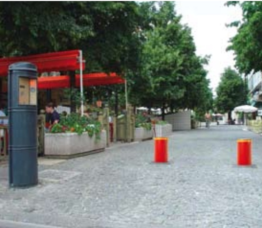
contrôle de l'accès des véhicules