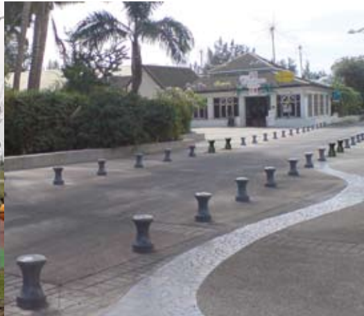
allées et rues