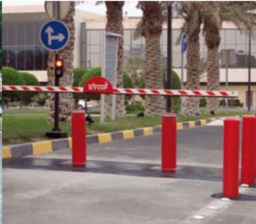
accès contrôlés et sécurisés