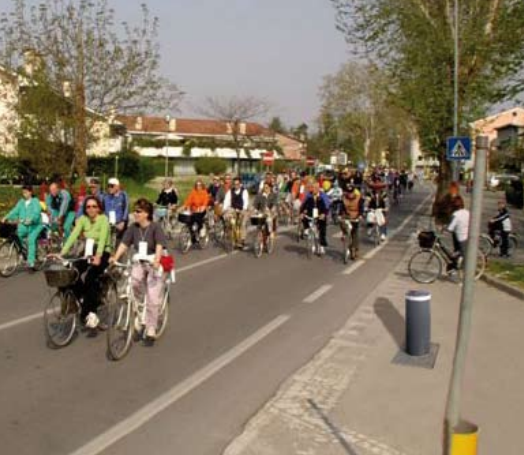
interdiction de circuler